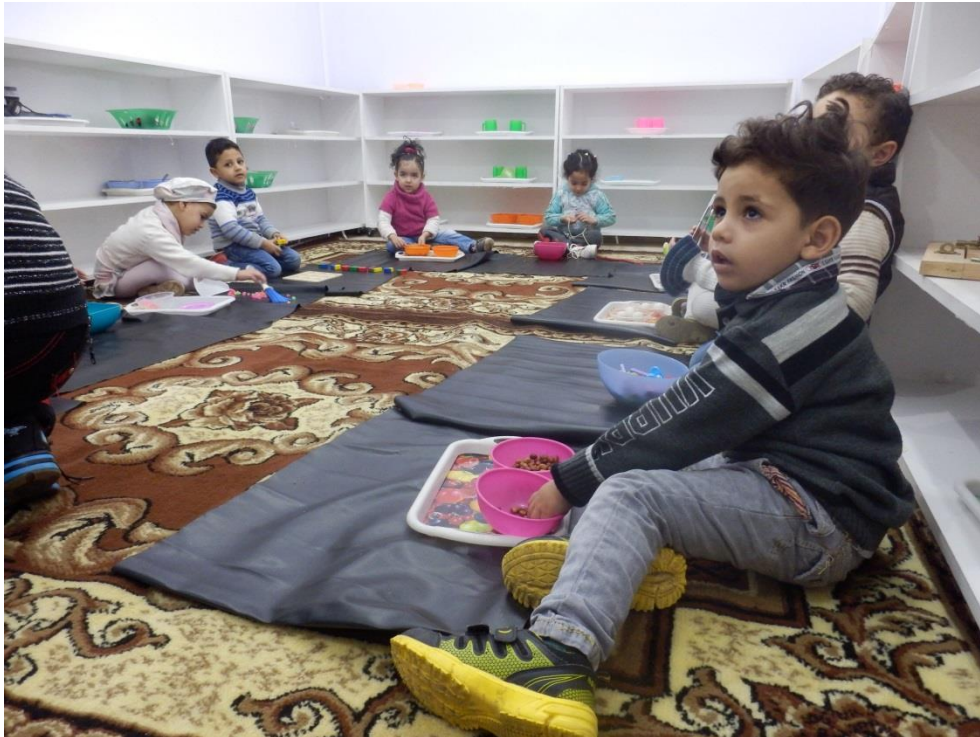
Kinderen ontwikkelen motorieke vaardigheden