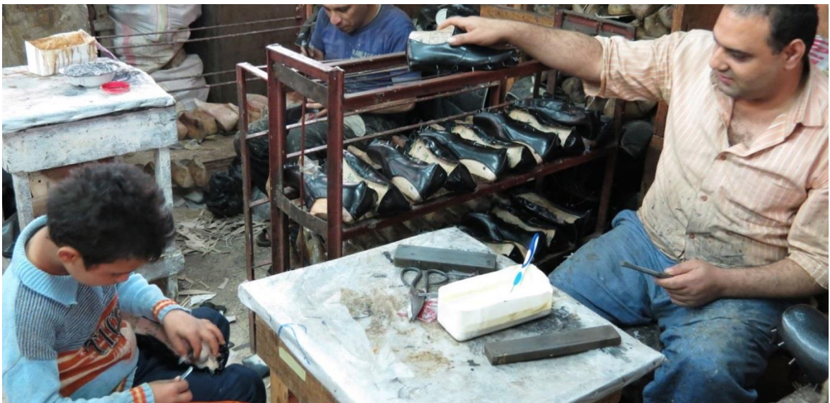
Vocational Center waar niet-schooldplichtige kinderen een beroep leren. De schoenen worden uitgedeeld aan de families van de kinderen.

Op 30 september 2017 zijn twee Egyptische medewerkers, op uitnodiging van het bestuur, naar Nederland gekomen om de projecten en het werk in Egypte voor de sponsors toe te lichten.