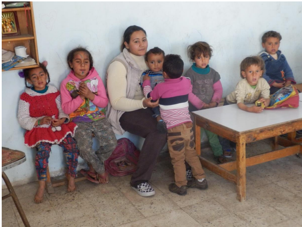
Sloppenwijk El Helwan: kinderen in hun eigen school